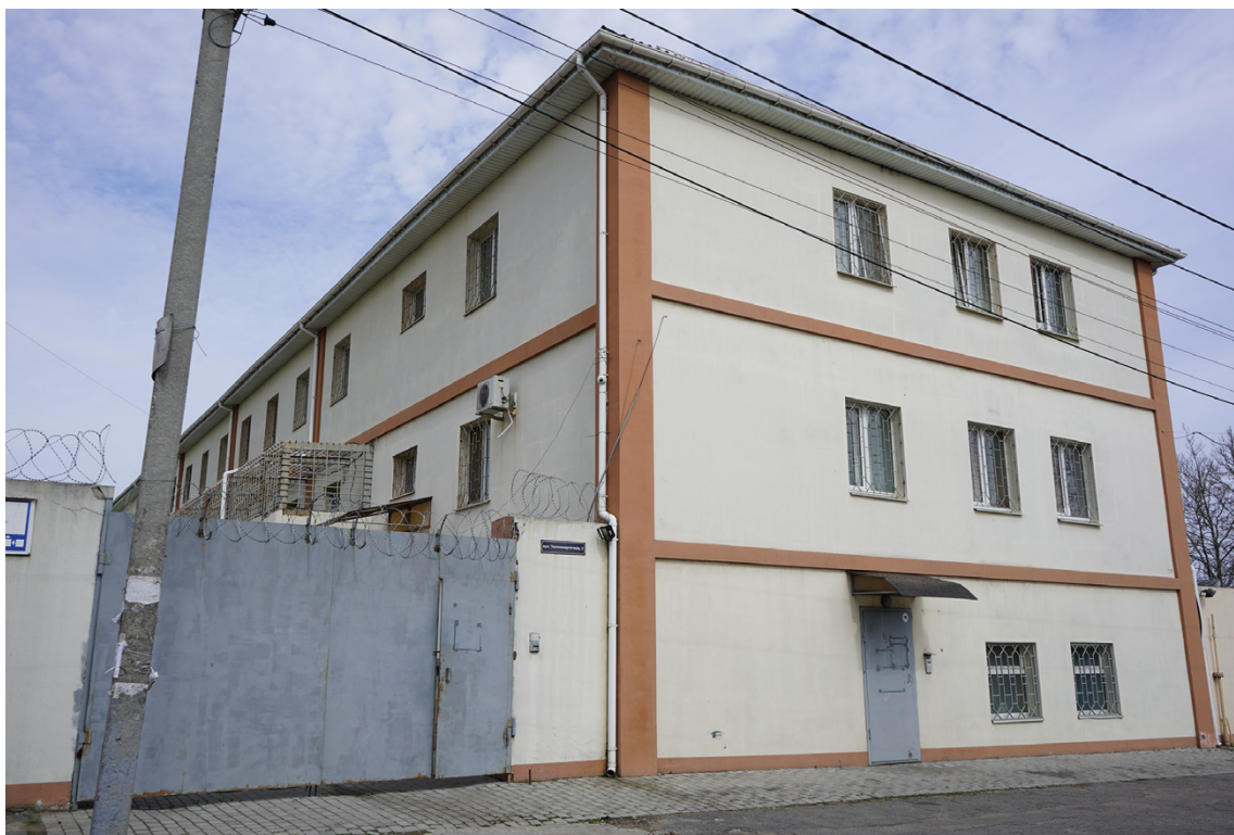
■ Ізолятор тимчасового тримання № 1 Головного управління Національної поліції в Херсонській області

В ІТТ протягом окупації Херсона тримали понад 200 осіб. Наразі за фактом незаконного тримання громадян України в ІТТ відкрито 40 кримінальних проваджень, які надалі були об'єднані в одне кримінальне провадження, відкрите за ознаками складу злочинів, передбачених чч. 1, 2 ст. 438 (Порушення законів та звичаїв війни) та ч. 7 ст. 111-1 ККУ (Колабораційна діяльність). Органи прокуратури визнали потерпілими та допитали 21 жінку 7 . Проте, Центру прав людини ZMINA вдалося встановити, що в різний час в ІТТ перебували щонайменше тридцять жінок. Жінок, на свідченнях яких засновано звіт, затримували протягом літа – переважно в липні-серпні 2022 року, та утримували до кінця жовтня, коли російські війська почали відступ з правого берегу Херсонщини.