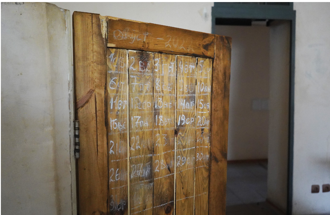
■ Імпровізований календар в одній з камер ІТТ

Одним із засобів психологічного тиску була також тривалість перебування в ІТТ без інформування постраждалих і членів їхніх родин про подальшу долю та процедури, які на них очікують, або ж затягування очікування допитів. Декому повідомляли про те, що допит буде через два дні, а відбувався він через шість днів. Одна постраждала вперше потрапила на допит на дванадцятий день перебування в ІТТ.