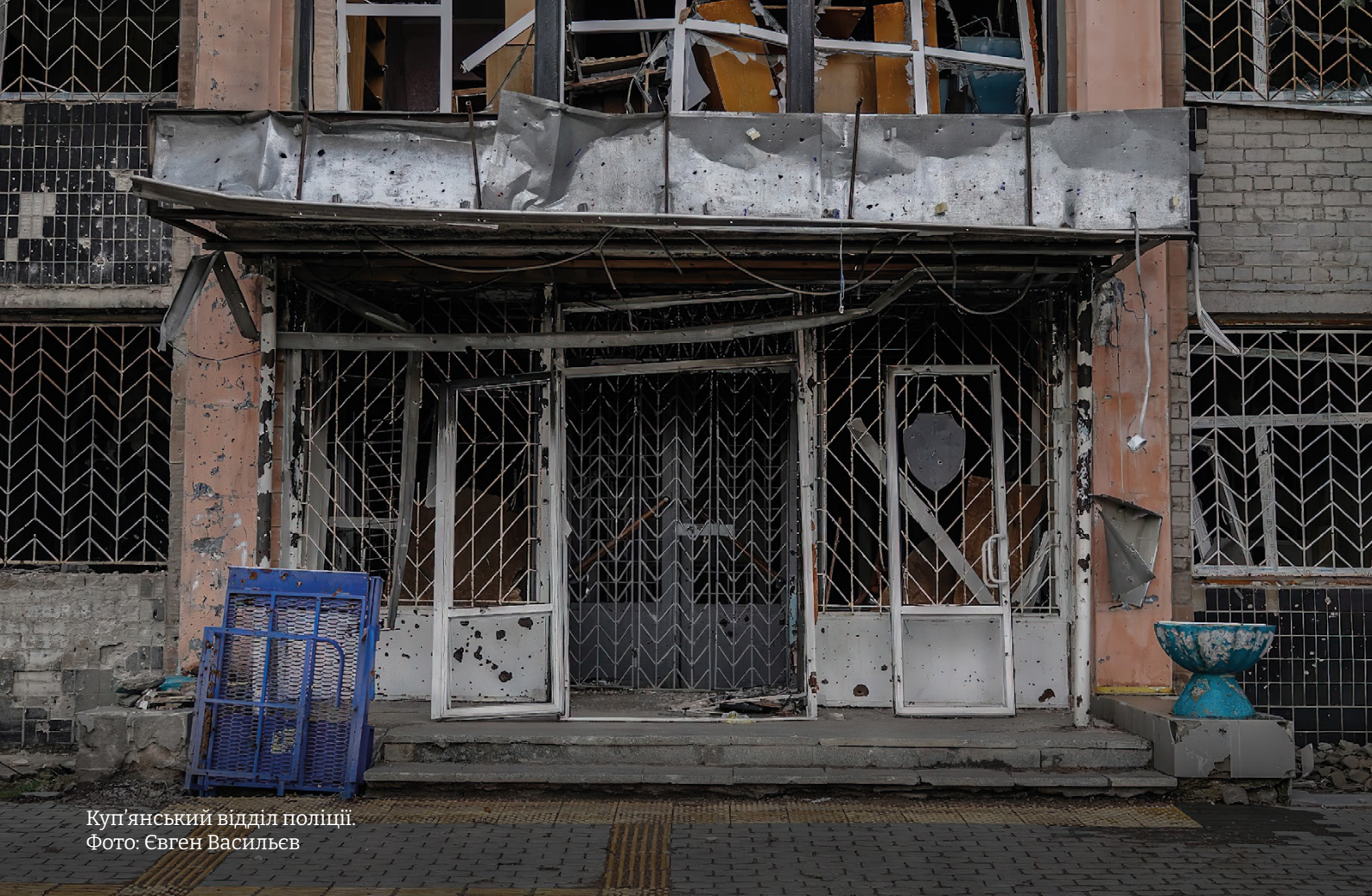
Куп'янський відділ поліції.