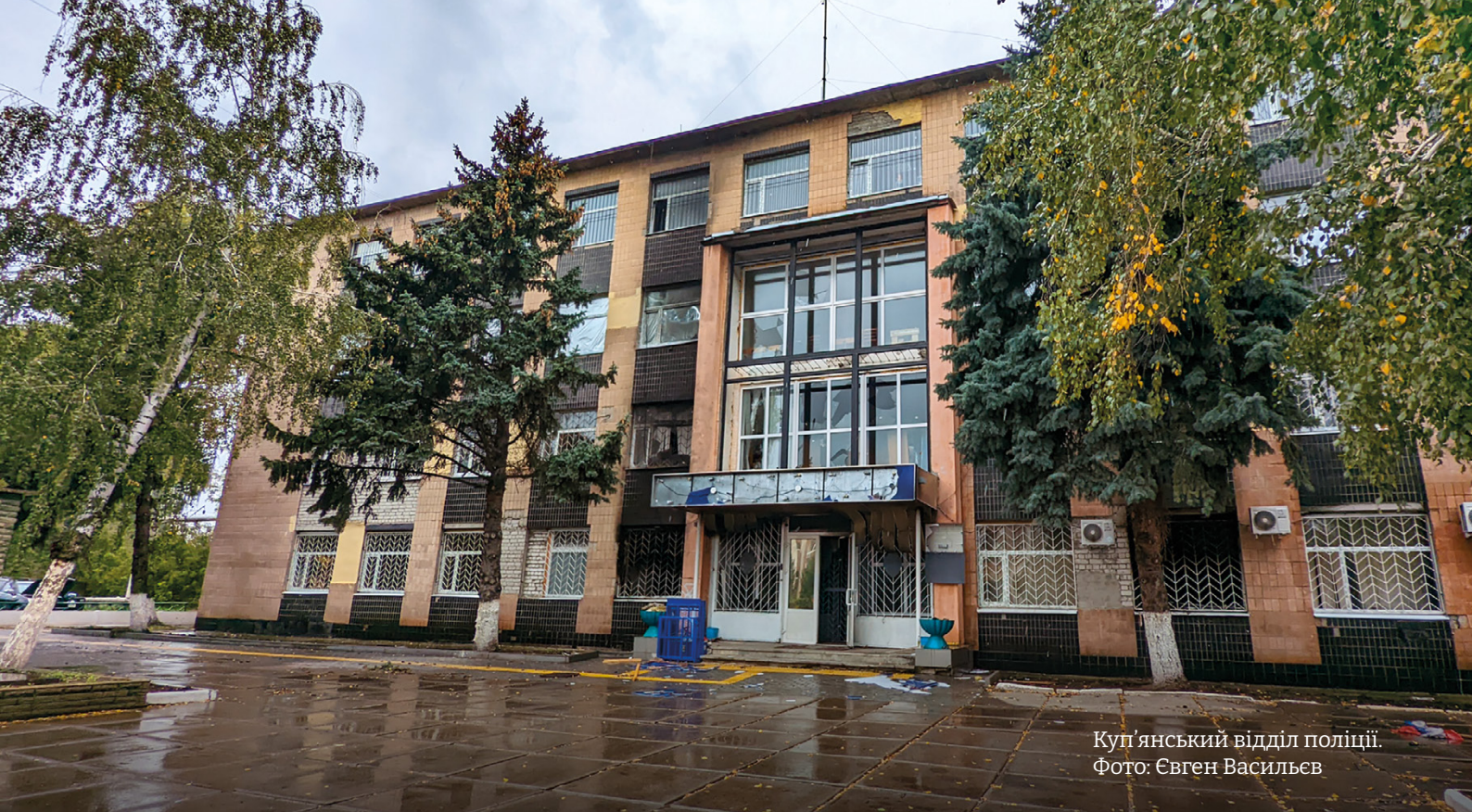
Куп'янський відділ поліції.