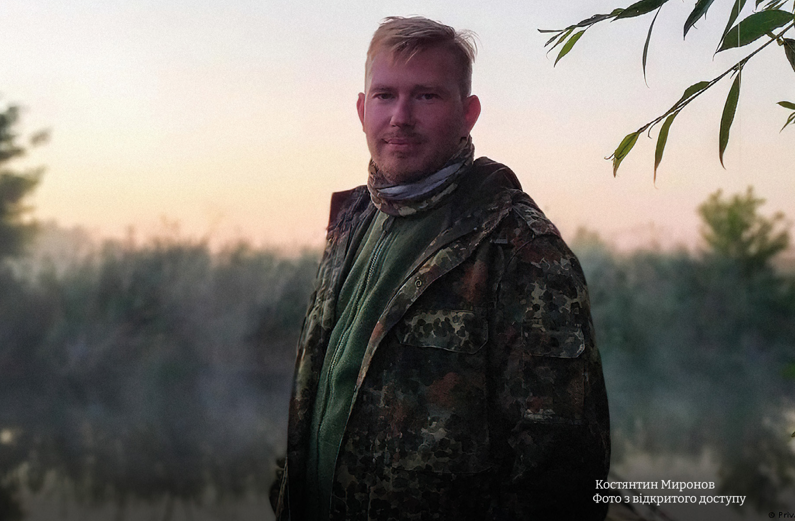
Костянтин Миронов