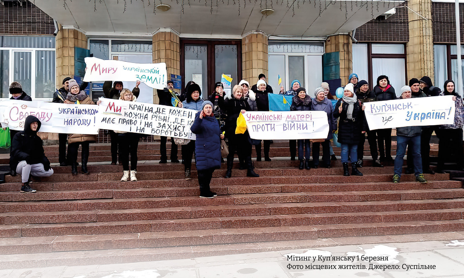
Мітинг у Куп'янську 1 березня