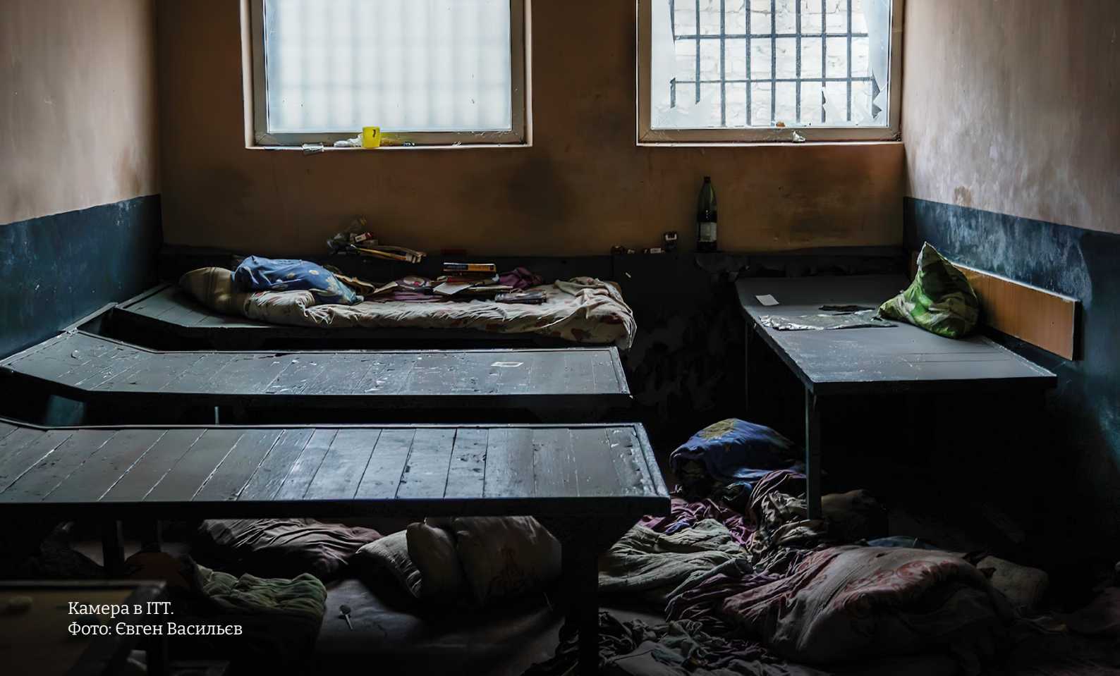
Камера в ІТТ.