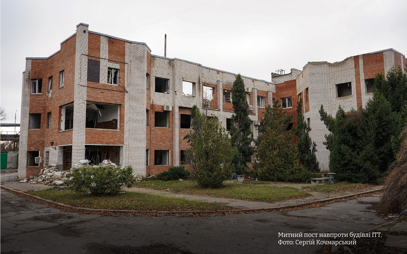
Митний пост навпроти будівлі ІТТ.