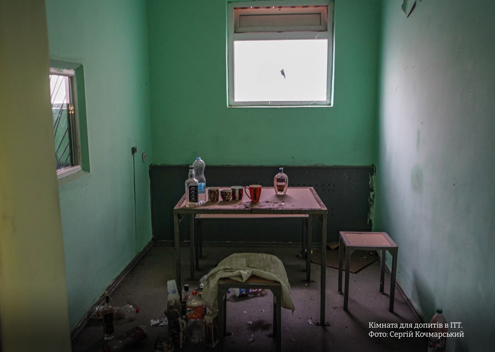
Кімната для допитів в ІТТ.