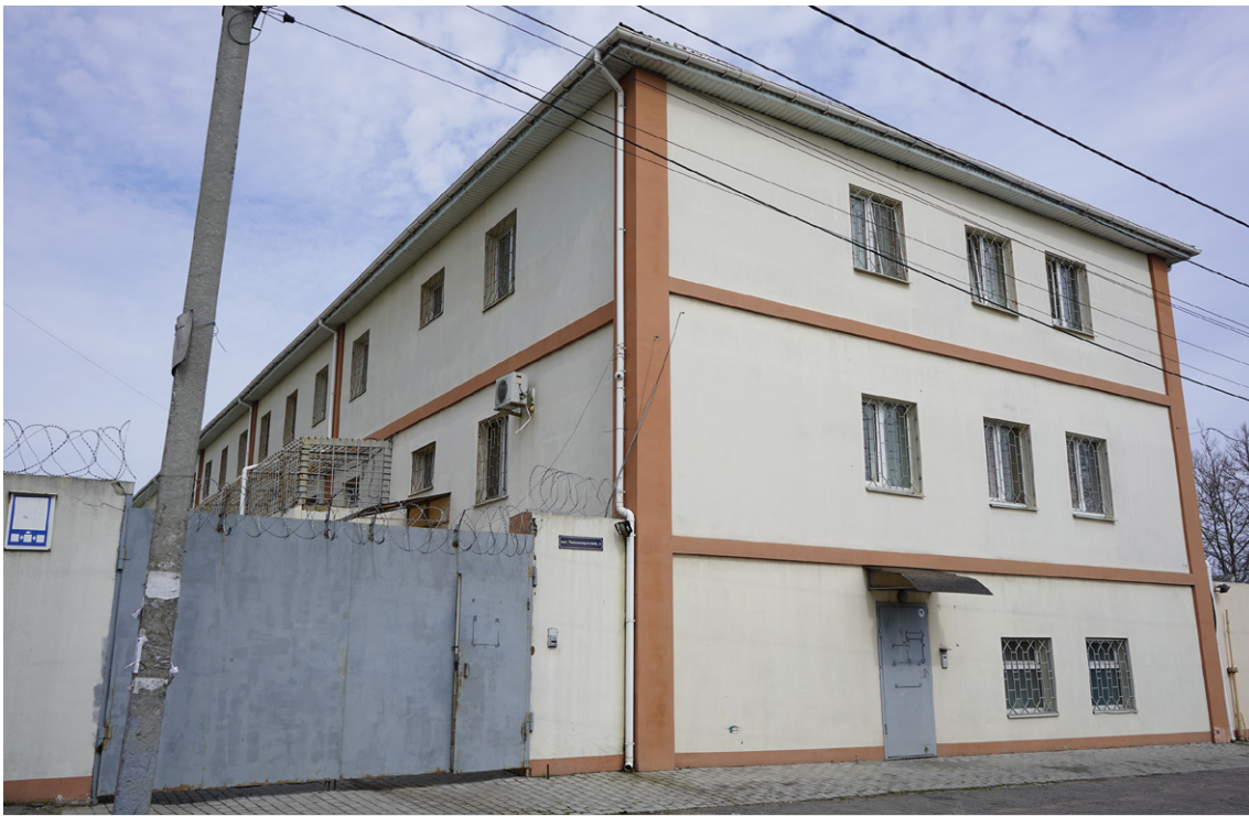
■ Ізолятор тимчасового тримання № 1 Головного управління Національної поліції в Херсонській області

В ІТТ протягом окупації Херсона тримали понад 200 осіб. Наразі за фактом незаконного тримання громадян України в ІТТ відкрито 40 кримінальних проваджень, які надалі були об'єднані в одне кримінальне провадження, відкрите за ознаками складу злочинів, передбачених чч. 1, 2 ст. 438 (Порушення законів та звичаїв війни) та ч. 7 ст. 111-1 ККУ (Колабораційна діяльність). Органи прокуратури визнали потерпілими та допитали 21 жінку 7 . Проте, Центру прав людини ZMINA вдалося встановити, що в різний час в ІТТ перебували щонайменше тридцять жінок. Жінок, на свідченнях яких засновано звіт, затримували протягом літа – переважно в липні-серпні 2022 року, та утримували до кінця жовтня, коли російські війська почали відступ з правого берегу Херсонщини.