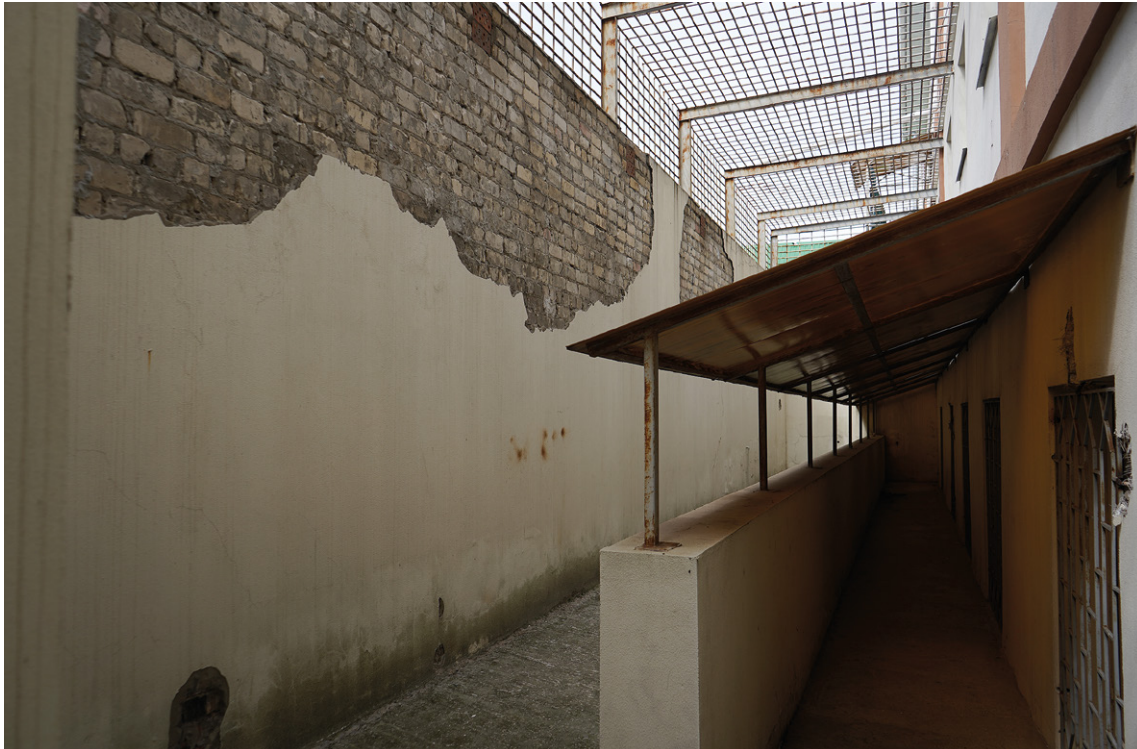
■ Прогулянковий двір на території ІТТ

Збір персональної інформації від затриманих був надмірним — деякі респонденти повідомляли про зняття відбитків з пальців та долоні, фотографування шість-сім разів протягом всього часу тримання. Це може свідчити також про неналежне зберігання цих даних, а також відсутність належної комунікації між різними підрозділами, які в різний час наглядали за ІТТ. Крім того, зняття відбитків також відбувалося всупереч будь-якій процедурі — у постраждалих очі були закриті маскою, і знімали її лише для того, щоб вони підписали свої відбитки 46 .