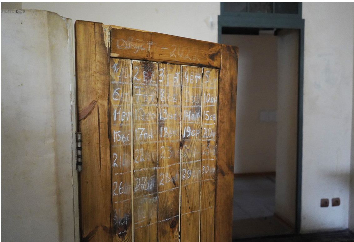
■ Імпровізований календар в одній з камер ІТТ

Одним із засобів психологічного тиску була також тривалість перебування в ІТТ без інформування постраждалих і членів їхніх родин про подальшу долю та процедури, які на них очікують, або ж затягування очікування допитів. Декому повідомляли про те, що допит буде через два дні, а відбувався він через шість днів. Одна постраждала вперше потрапила на допит на дванадцятий день перебування в ІТТ.