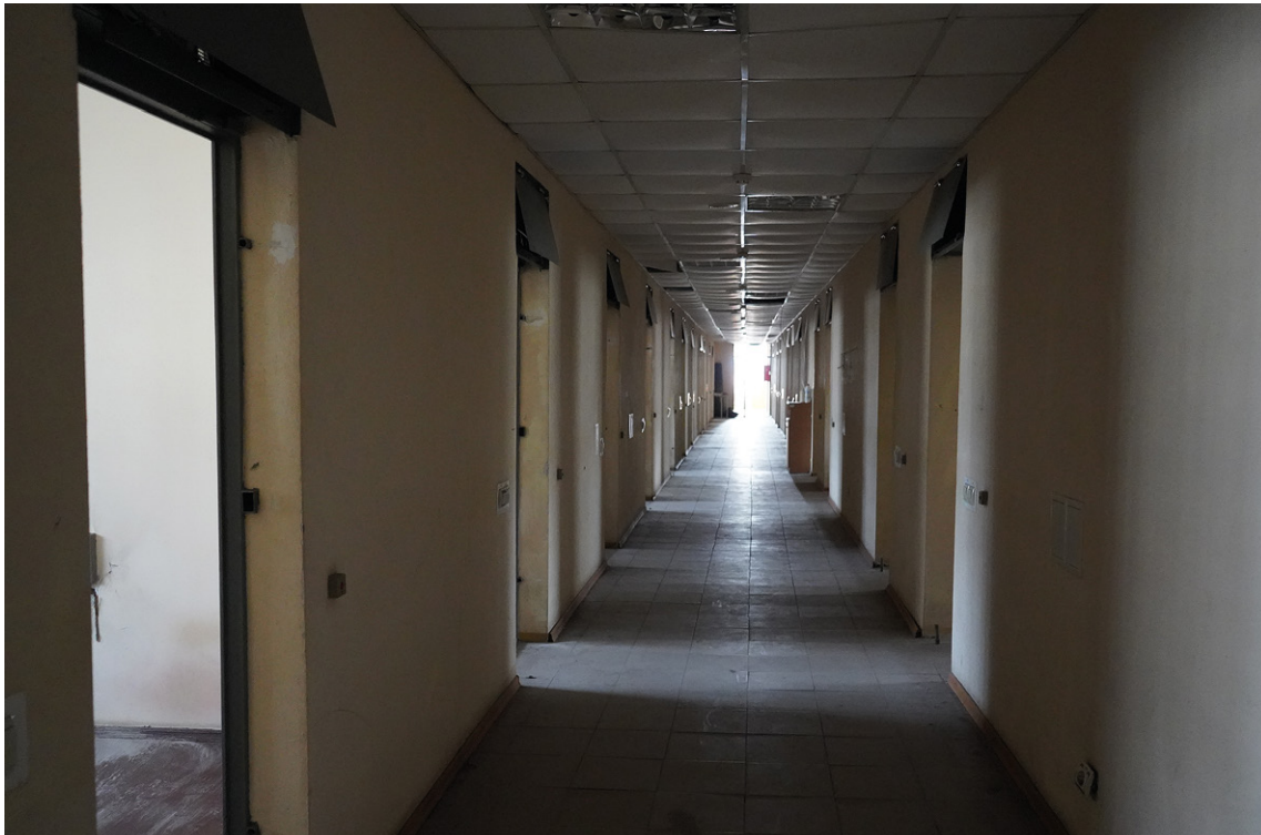
■ Поверх, на якому розташовані камери, де утримували людей

В іншому випадку під час допиту, після утримання в ІТТ протягом майже двох місяців, постраждалій дали на підпис документи, які містили відомості про те, що її звинувачують у шпигунстві, а тоді заявили, що вивезуть на відбування покарання, від 10 до 20 років позбавлення волі згідно з санкцією статті, в окупований Донецьк 27 . Які саме дії становили шпигунство, постраждалій не пояснювали.