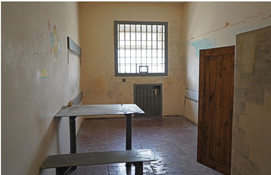
■ Одна з камер ІТТ, в якій утримували жінок

Через те, що камери розраховані на меншу кількість людей, спати доводилося на підлозі — матраців на всіх теж не вистачало, подушок не було, деякі жінки скручували ковдри та спали на них.