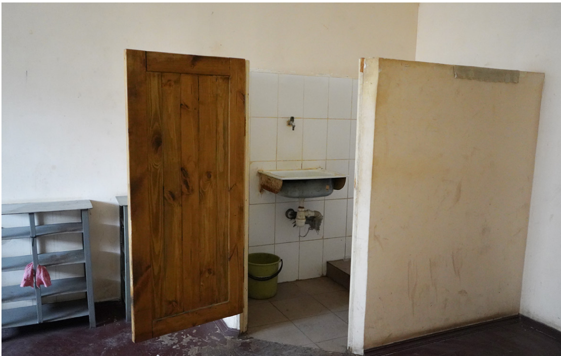
■ Туалет в одній з камер ІТТ

Гігієна не була належно забезпечена. В деяких камерах була проточна вода в умивальниках, тож була можливість ополіскуватися. Згідно зі свідченнями, спершу — орієнтовно 21 день — затримані не мали можливості повноцінно митися взагалі 40 . Пізніше лише жінок, яких утримували в ІТТ, почали водити в душ, виділяючи для цього п'ять хвилин на всіх. При цьому такі заходи не були регулярні: в душ водили залежно від настрою старшого в ІТТ — Андрея «Злого». Могли водити кожен день, а могли п'ять днів поспіль не водити 41 .